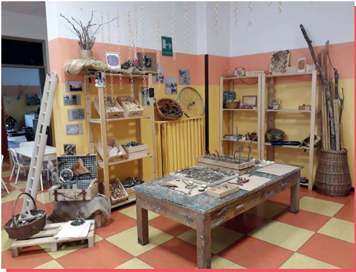
Ordine, organizzazione, cura