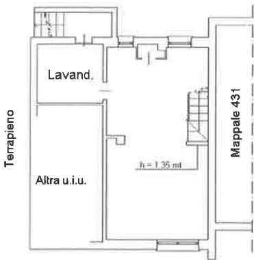
PIANO PRIMO INTERRATO h = 2.40 mt