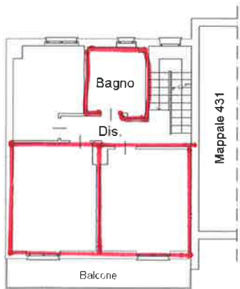
PIANO PRIMO h = 2.80 mt