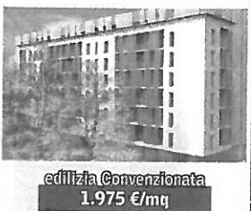
edilizia Convenzionata 1.975 €/mq

coop. Solidarnosc e Cclcerchicasa l'intervento prevede la realizzazione di 70 alloggi in proprietà su terreno in diritto di superficie. info 02.77.116.300 - 338.73.56.054