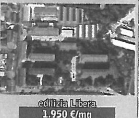
edilizia Libera 1.950 €/mq

coop. cclcerchicasa sono aperte le adesioni per un prossimo intervento in via Cima 39 (zona Lambrate) info 02.77.116.300 / 314