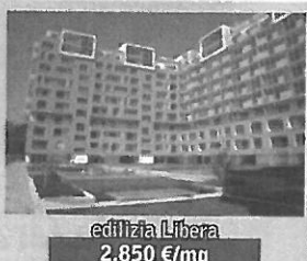
edilizia Libera 2.850 €/mq

coop. Solidarnosc Milano Nord nella zona Nord di Milano alloggi di qualità di 2, 3, 4 locali in piena proprietà. PRONTA CONSEGNA info 02-77.116.300 - 338.44.59.124