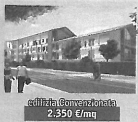
edilizia Convenzionata 2.350 €/mq

coop. Solidarnosc Borgo Porretta sono aperte adesioni alla cooperativa con la scelta degli alloggi. IN COSTRUZIONE info 02-77.116.300 / 314