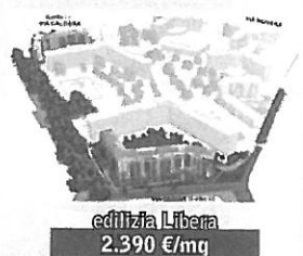
edilizia Libera 2.390 €/mq

coop. cclcerchicasa sono aperte adesioni alla cooperativa con la scelta degli alloggi. IN COSTRUZIONE info 02-77.116.300 / 314